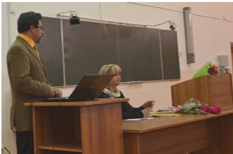
Секция "Актуальные вопросы офтальмологии".

больных в различных лечебных учреждениях Забайкалья, а также 4 доклада, представляющих результаты научных работ и внедрение их в практическое здравоохранение. В дискуссии активно участвовали как врачи с большим стажем работы, так и молодые доктора. В резолюции секции принят план научно-практических конференций и работы аттестационной комиссии на 2014 год.