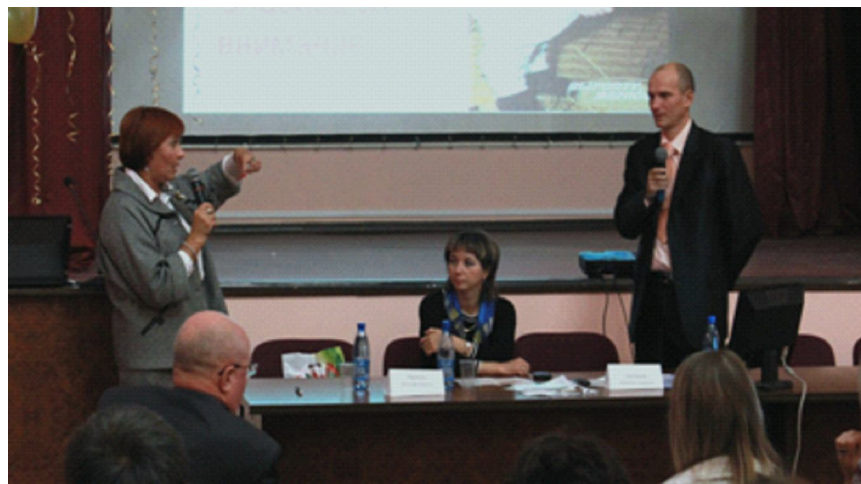
Секция "Актуальные вопросы педиатрии".

На заседании "Актуальные вопросы детской гастроэнтерологии" были представлены доклады о функциональных нарушениях желудочно-кишечного тракта (зав. кафедрой