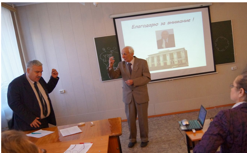
В споре рождается истина.