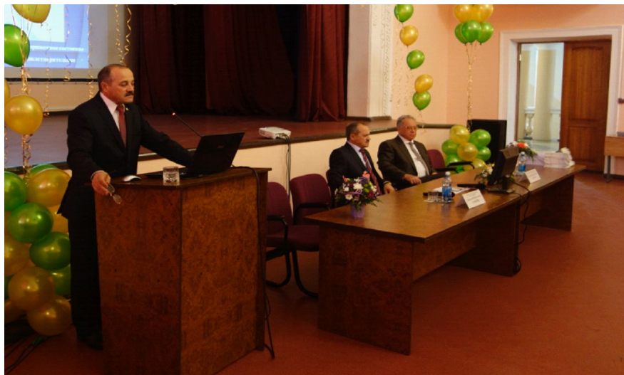
Секция "Актуальные вопросы неврологии, психиатрии и наркологии".