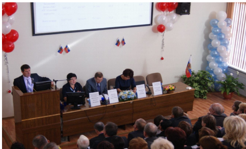
1 съезд региональной общественной организации "Забайкальское общество организаторов здравоохранения".

Участники секции пришли к выводу, что для решения основных задач территориального здравоохранения и реализации программ развития здравоохранения и обязательного медицинского страхования необходима консолидация практических и научных сил, интеграция представителей практического здравоохранения, научных работников, участников системы обязательного медицинского стра-