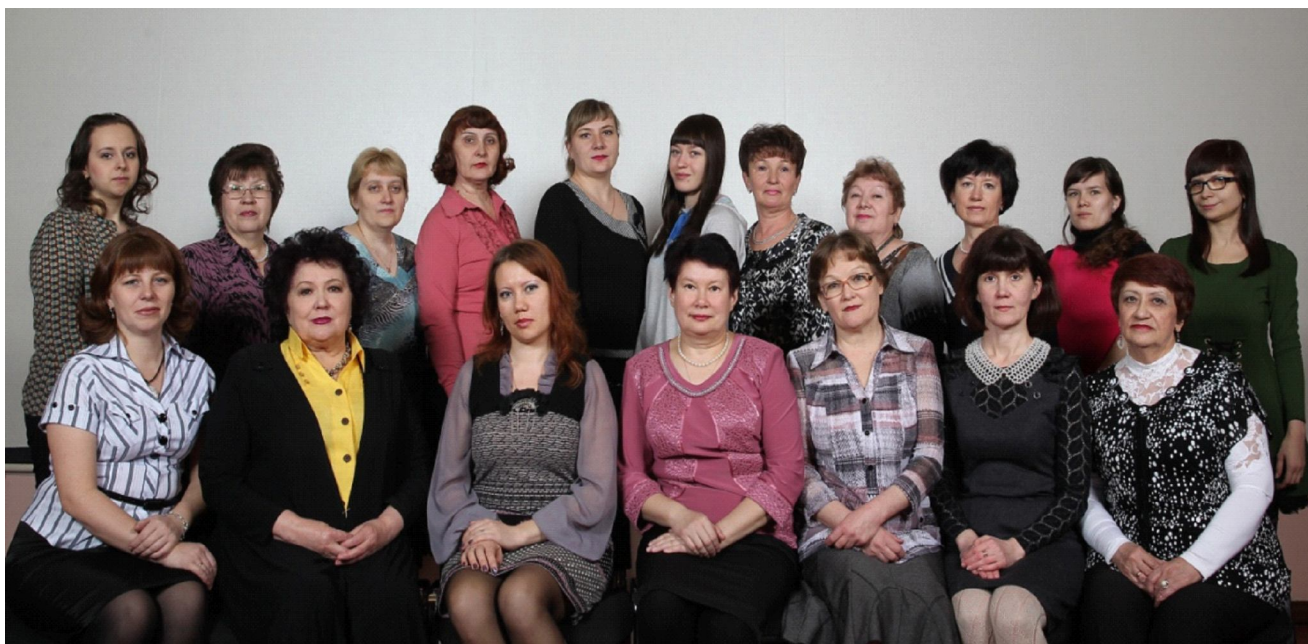
Коллектив библиотеки, 2013г.

большую массовую работу: литературные вечера, читательские конференции, многочисленные беседы, обзоры.