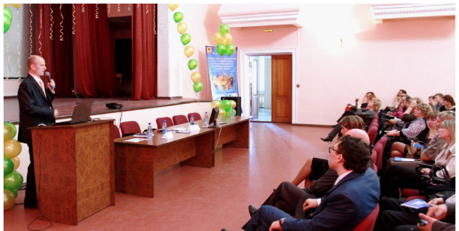
Секция "Актуальные вопросы интенсивной терапии в акушерстве, педиатрии и неонатологии".