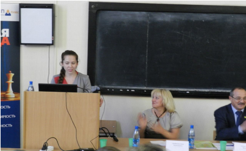
Секция "Актуальные вопросы терапии".