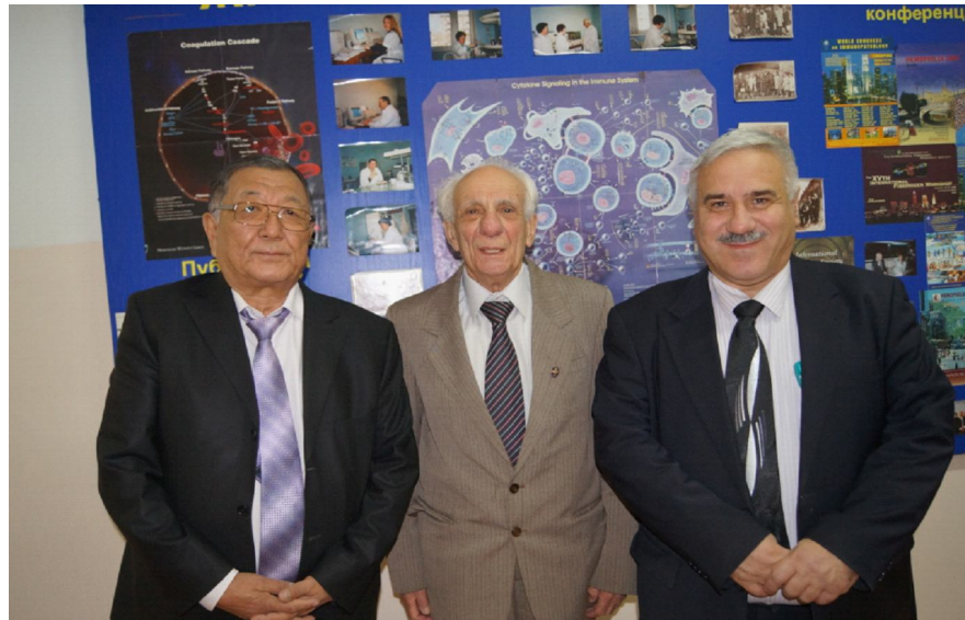
Секция "Достижения фундаментальных наук - клинической медицины".