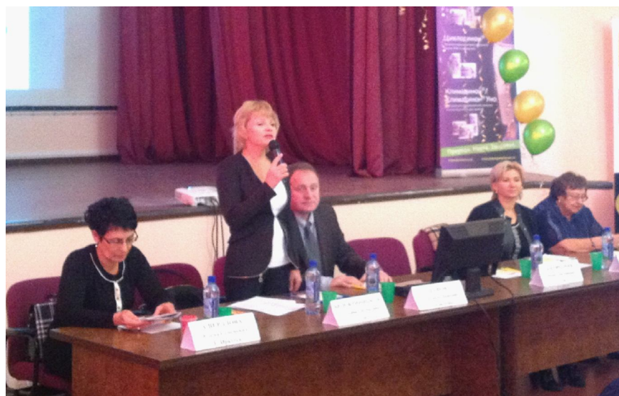
Секция "Актуальные проблемы акушерства и гинекологии".